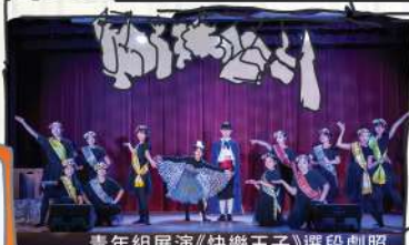
青年組展演《快樂王子》選段劇照

因應學員不同的年齡層、不同的程度，我們為各班精心打造課程內容，從唯獨舞台過往的作品中，精選及剪裁出五段合適展演的選段，均節錄自唯獨舞台過往公演之本地專業音樂劇作品，供本屆學員作為實戰之用。