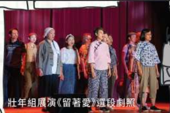
壯年組展演《留著愛》選段劇照