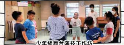
少年組舞台演技工作坊