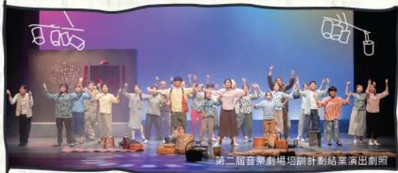
第二屆音樂劇場培訓計劃結業演出劇照

康樂及文化事務署與唯獨舞台、長沙灣綜合家庭服務中心及賽馬會創意藝術中心合作，在深水埗區推行「十八有藝」社區演藝計劃，透過可延續及深化的活動在區內推廣表演藝術，讓市民觀賞之餘，更可以參與在其中，親身體驗藝術如何令大眾與社區更有活力。