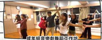
成年組音樂劇舞蹈工作坊